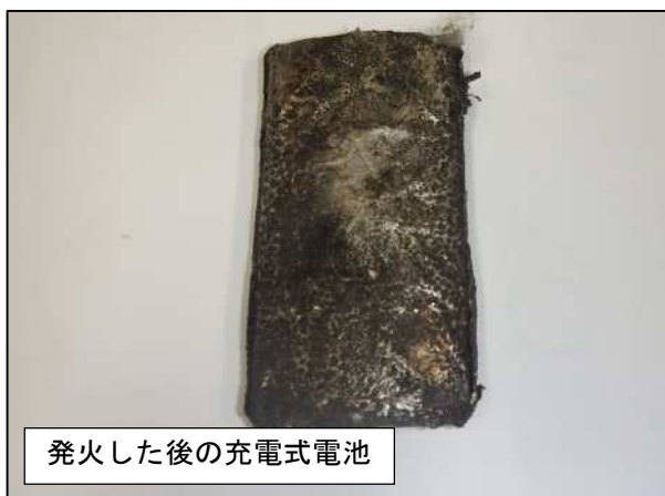
発火した後の充電式電池