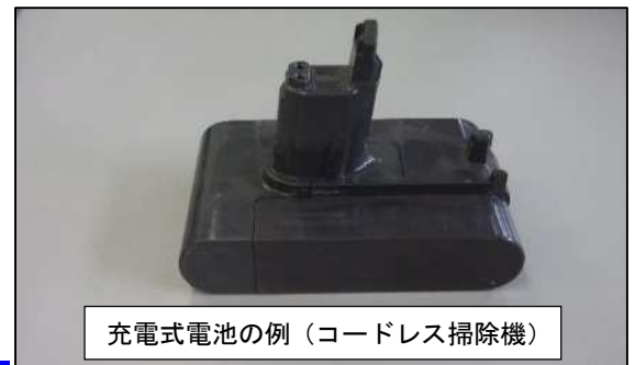
充電式電池の例（コードレス掃除機）

説明書確認のうえ小型家電製品から充電式電池を取り外してください。 取り外した充電式電池は、家電量販店等にあるリサイクルボックスに出してください。 宮沢清掃センター窓口でも受付けています。