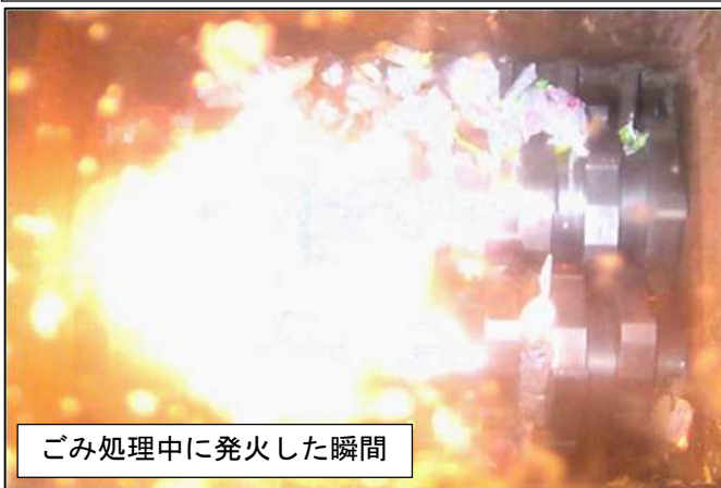
ごみ処理中に発火した瞬間

宮沢清掃センターでは、ごみ処理作業中に発火トラブルが増加しています。原因はごみに混入した充電式電池が破砕処理の際にショート・発火したためと考えられます。発火トラブルは重大な事故に繋がる可能性があり、場合によっては、復旧のためごみ処理業務を長期間停止しなければならない事態になります。充電式電池の適正な処分にご協力をよろしくお願いいたします。