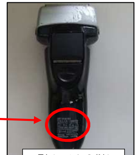
電気かみそりの記載例